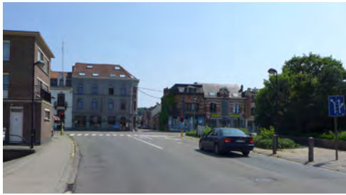
zicht op Leuvensesteenweg