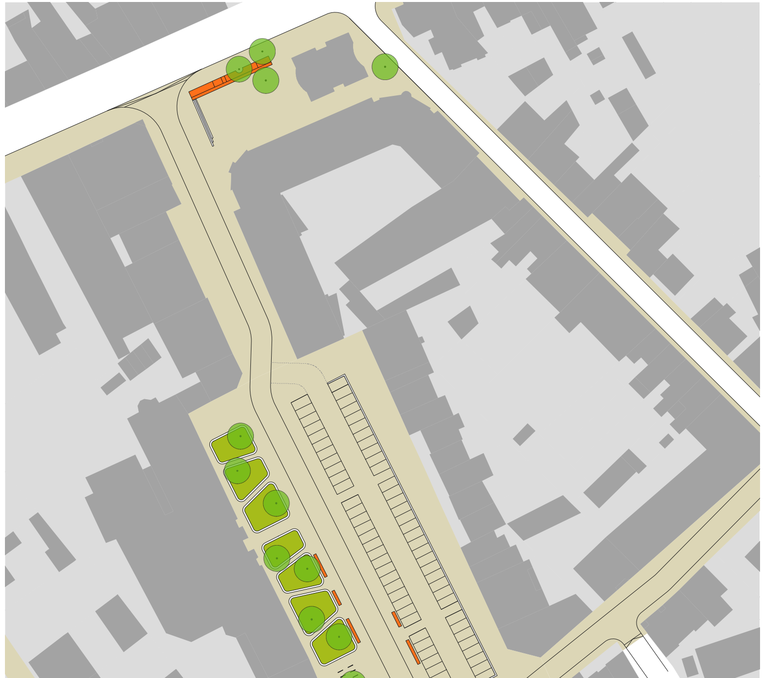
illustratieve schets van de herinrichting van het openbaar domein op het Dr. V. De Walsplein en het Craenenplein