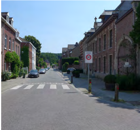
Kiewitstraat, kijkend richting de abdij