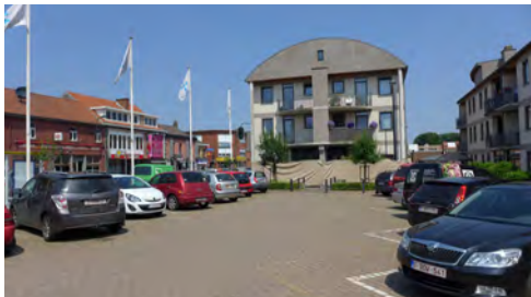
Dr. V. De Walsplein