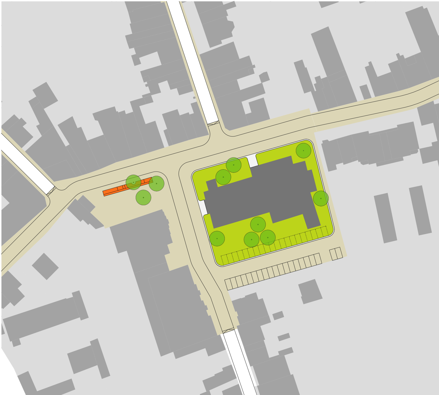
illustratieve schets van de herinrichting van het openbaar domein rond de kerk en de Brouwerijstraat